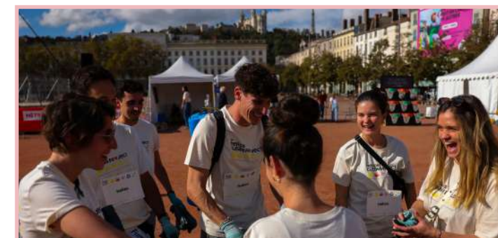
The Helios Clean Project Festival Lyon/Bellecour 2024