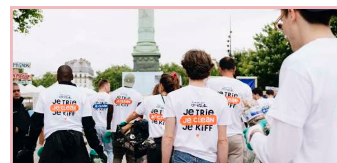
The Clean Project Festival Paris /Bastille 2025