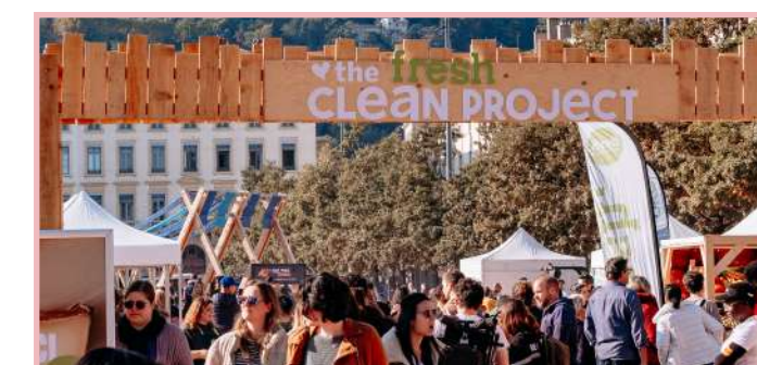
The fresh Clean Project Festival Lyon/Bellecour 2025